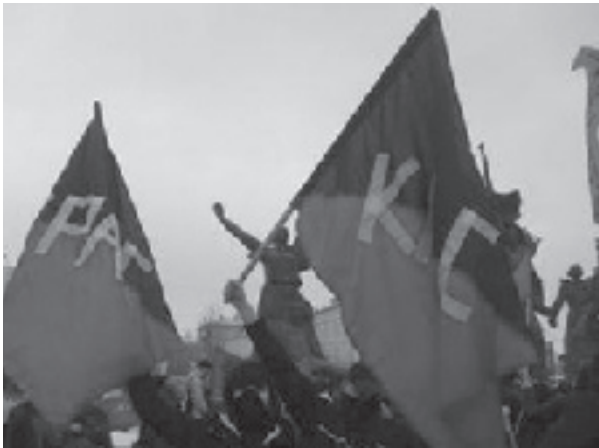
Московские анархо-синдикалисты на митинге в поддержку репрессированных рабочих активистов (1 марта)

забастовках, антиправительственных выступлениях, бунтах и захвате предприятий работниками, в России пока нет широкого сопротивления против кризиса. Число забастовок по-прежнему незначительно, а если они и происходят, то в основном под полным контролем соглашательских профсоюзов. О том, чего можно ожидать от этих бюрократических структур, ясно свидетельствуют недавние события.