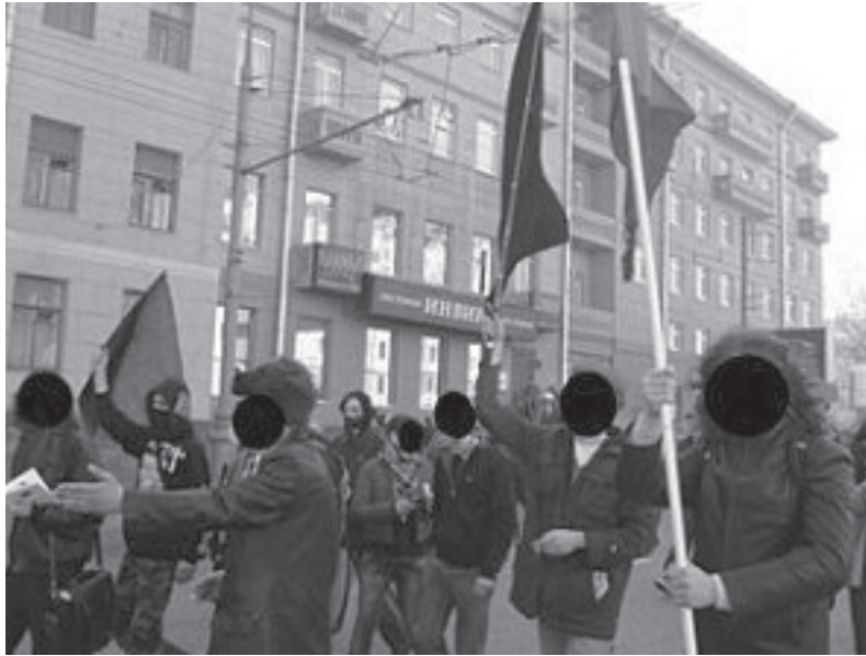
Члены КПАС - М.А.Т. на первомайской демонстрации 2009 г.

Для того, чтобы на практике готовить революцию, необходимо узнать, как работает ваше предприятие или учреждение, его смежники и поставщики, организовать обмен информацией между профсоюзами различных отраслей. Тогда, взяв в ходе стачки в свои руки контроль над своим районом, над средствами производства, связи и информации, трудящиеся не станут гадать, что им делать дальше, как им налаживать жизнь. Только